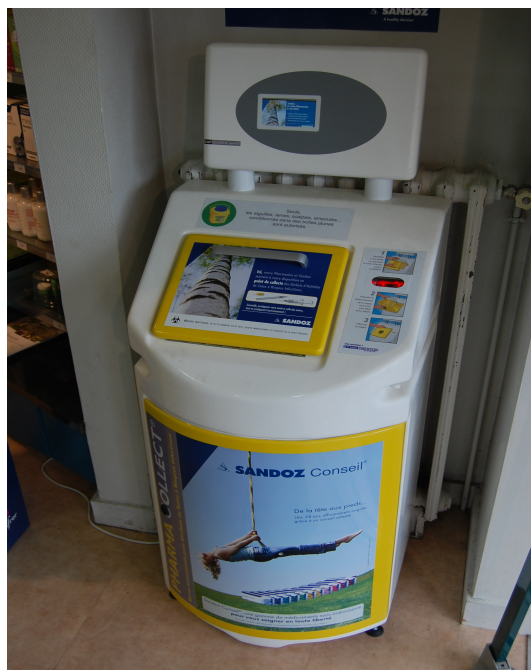
Exemple de collecteur présent à la Pharmacie de l'Europe, Coulaines