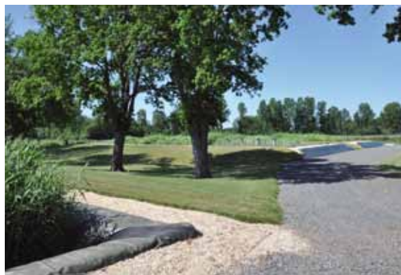
Station d'épuration de Montabon

Développement durable et de l'Environnement. Sur les 140 stations créées, réhabilitées ou remplacées, on recense trois procédés majoritaires : les filtres plantés de roseaux (52 stations), les systèmes de boues activées (43 stations) et les lagunes (27 stations). Sur ces 10 années, c'est 42,5 M€ d'aides qui ont été versées par le Conseil général pour les stations et les réseaux. Pour l'année 2011, le budget prévisionnel dédié à l'assainissement des communes rurales s'élève à 2,3 M€, dont 1,9 M€ pour les stations et plus de 389 000 € pour les réseaux.