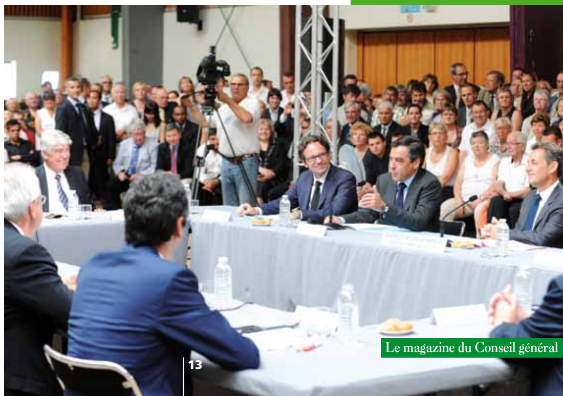
Le magazine du Conseil général