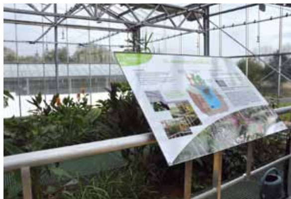
Station d'épuration du Lude