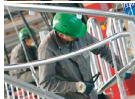
Visite de l'entreprise Galva 72.