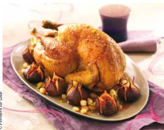
Chapon de Pintade Fermier de Loué rôti aux Figues.

Pas de fêtes de fin d'année sans une succulente volaille de Loué, parole de gourmet ! Au-delà du simple plaisir culinaire, cette période festive correspond à un véritable treizième mois pour les fermiers de Loué !