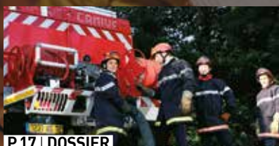
P.17 | DOSSIER Les sapeurs-pompiers de la Sarthe