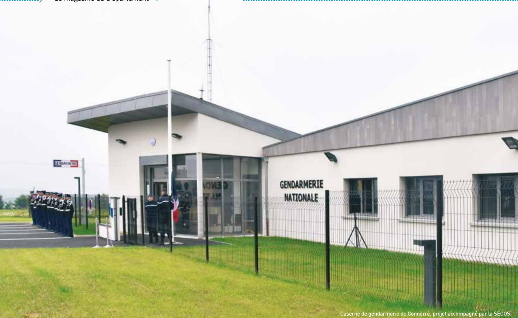
Caserne de gendarmerie de Connerré, projet accompagné par la SECOS.