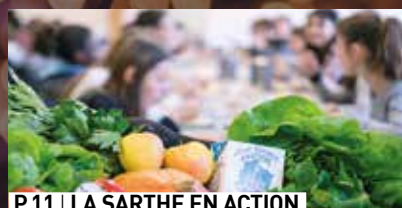
P.11 | LA SARTHE EN ACTION Au collège, les élèves mangent local